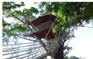
ДОМ-ДЕРЕВО В МАЙНЛИНОНГ