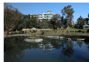
ЛЕДИ ХИДАРИ ПАРК