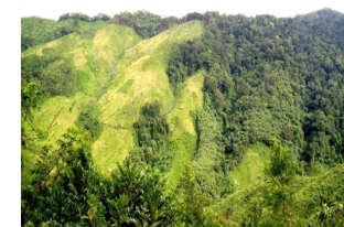
НОРКЕК НАЦИОНАЛЬНЫЙ ПАРК